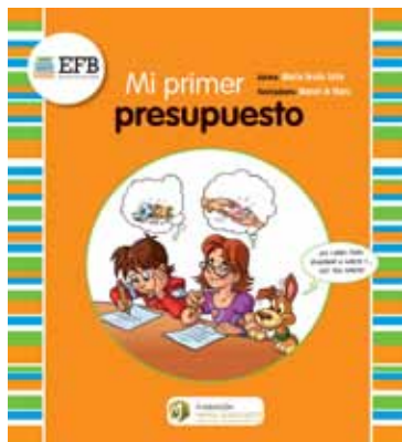
Primer y segundo ciclo