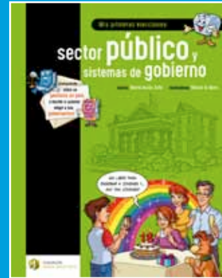
Mis primeras elecciones: sector público y sistemas de gobierno