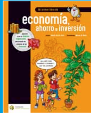
Mi primer libro de economía, ahorro e inversión