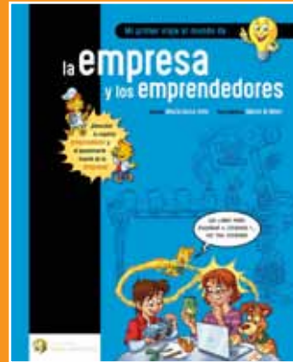
Mi primer viaje al mundo de la empresa y los emprendedores