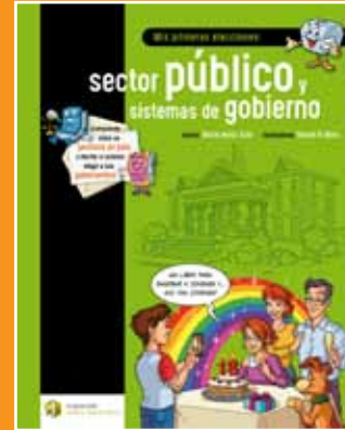
Mis primeras elecciones: sector público y sistemas de gobierno